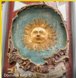
Dominik Ketz © TI