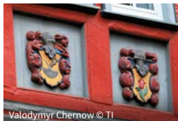
Valodymyr Chernow © TI

Auffallend schönes mitteldeutsches Fachwerk. Markant: Haus „Zum Reichsapfel“ (Engelsgasse 2/Ecke Kornmarkt), Fachwerkbau der deutschen Renaissance „Zur Alten Münz“ (Eisenmarkt 9), Wetzlars ältestes Fachwerkhaus aus dem Jahr 1356 (Brodschirm 6).