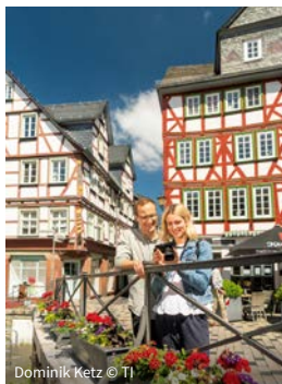
Dominik Ketz © TI