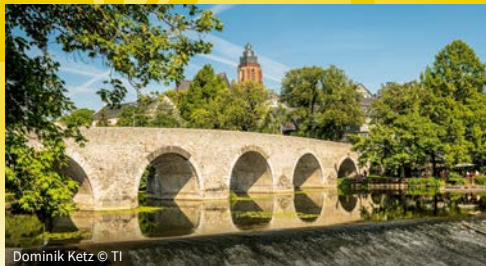
Dominik Ketz © TI